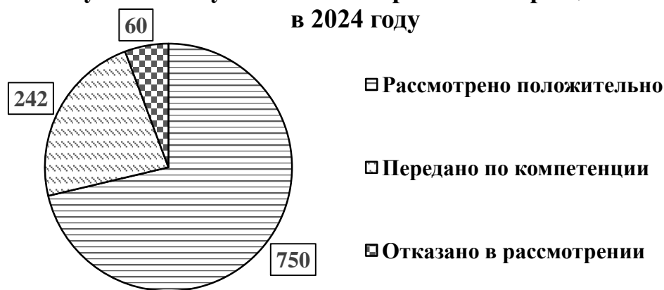
Рисунок 2. Результативность работы с обращениями в 2024 году

Помимо еженедельных приёмов населения в Великом Новгороде в отчётном году в соответствии с Соглашением о порядке взаимодействия Уполномоченного по правам человека в Новгородской области и государственного областного автономного учреждения «Многофункциональный центр предоставления государственных и муниципальных услуг» от 30.01.2024 Уполномоченный провёл приёмы населения в общественных приёмных на базе центров «Мои документы» в Боровичском, Старорусском, Валдайском районах. В ходе этих приёмов к Уполномоченному поступило 12 обращений.