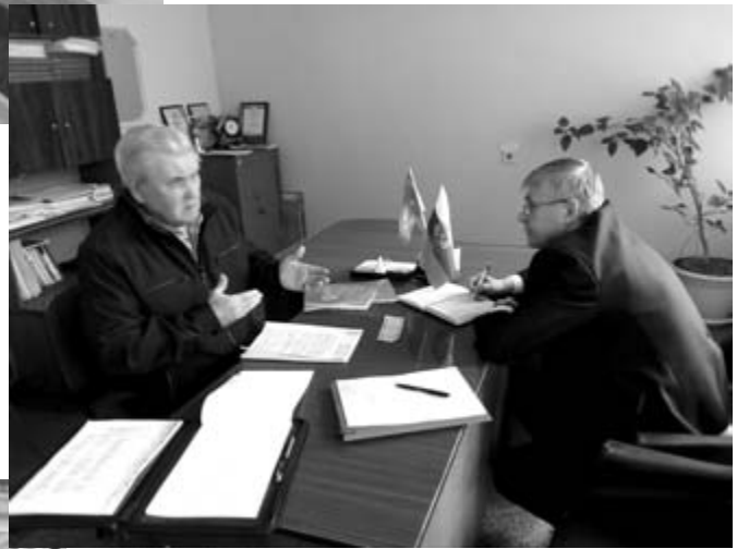
Приём населения в Демянском районе. Апрель, 2017 год