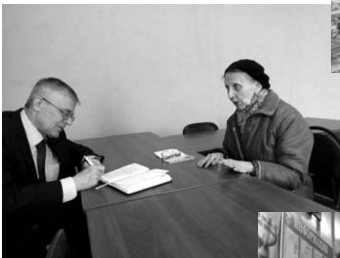
Приём населения в Любытинском районе. Май, 2017 год