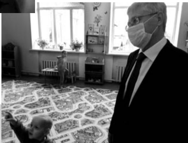
Посещение приюта для детей в д. Федорково Парфинского района. Апрель, 2017 год