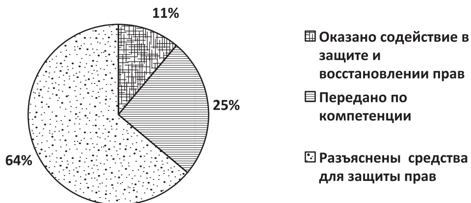
Рисунок 2 Результативность рассмотрения обращений граждан в 2017 году

В результате рассмотрения обращений, поступивших к Уполномоченному в 2017 году, в 83 случаях (11%) оказано содействие гражданам в реализации и восстановлении своих прав, 187 (25%) обращений переданы для рассмотрения по существу в органы власти, в компетенции которых находится их разрешение, по остальным 479 (64%) обращениям заявителям разъяснены средства, которые те в праве использовать для защиты своих прав и свобод, то есть проведена информационно-разъяснительная работа в рамках правового просвещения граждан.