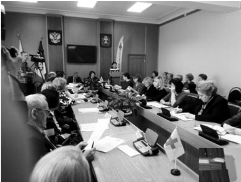
Заседание круглого стола по реализации проекта «Поддержка бывших малолетних узников фашизма в Новгородской области». Март, 2017