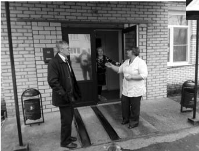
Посещение Дома-интерната для престарелых и инвалидов в п. Кневицы Демянского района. Апрель, 2017 год