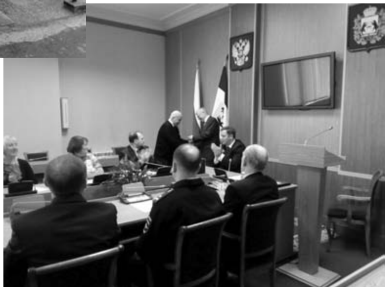
Вручение мандатов членам вновь сформированной Общественной наблюдательной комиссии по контролю за обеспечением прав человека в местах принудительного содержания. Апрель, 2017 год