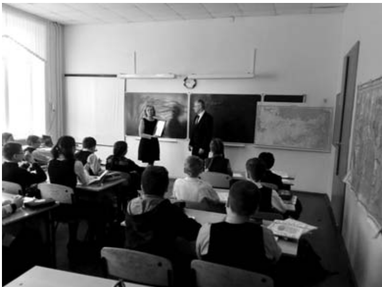
Вручение Благодарственных писем Уполномоченного по правам человека в Новгородской области участникам акции «Право помнить» – обучающимся МАОУ «Гимназия №2» Великого Новгорода. Апрель, 2017 год