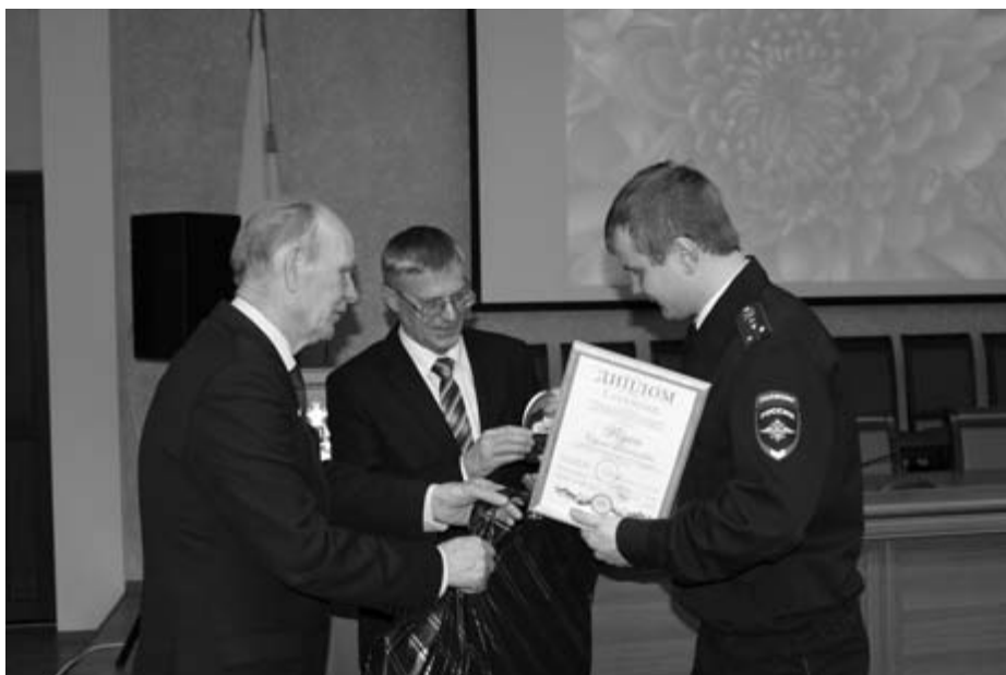
Награждение победителей конкурса участковых уполномоченных полиции, «Наш участковый – Анискин XXI века». Ноябрь, 2017 год