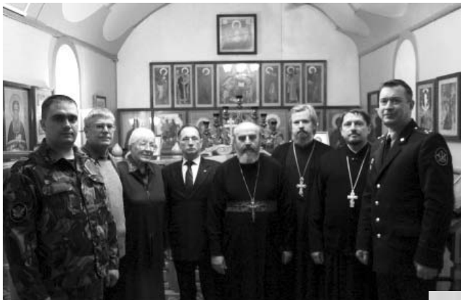
С участниками Божественной литургии в домовом храме, устроенном и освящённом в честь святой великомученицы Анастасии Узорешительницы в стенах ФКУ СИЗО-1. Январь, 2017 год