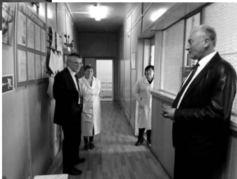
Посещение Неболчской сельской амбулатории в Любытинском районе. Май, 2017 год