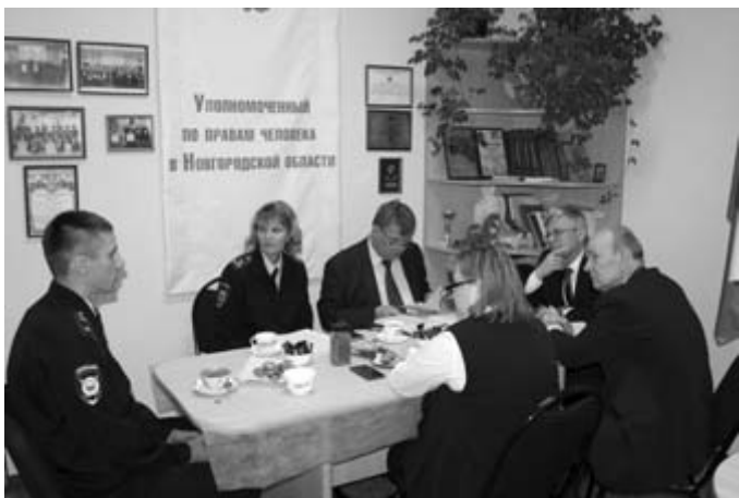
Собеседование с участковыми уполномоченными полиции, вышедшими в финал конкурса «Наш участковый – Анискин XXI века». Октябрь, 2017 год